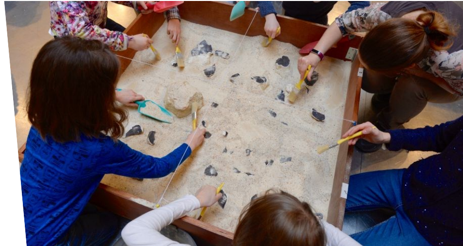
Homo sapiens Il y a 100 000 ans et encore aujourd'hui